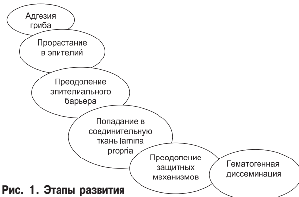
Рис. 1. Этапы развития кандидозной инфекции

Значительные трудности возникают при лечении рецидивирующей формы кандидозной инфекции. Несмотря на бурное развитие фармакологической индустрии и огромный выбор антимикотических препаратов, проблема лечения хронического рецидивирующего ВК не теряет своей актуальности.